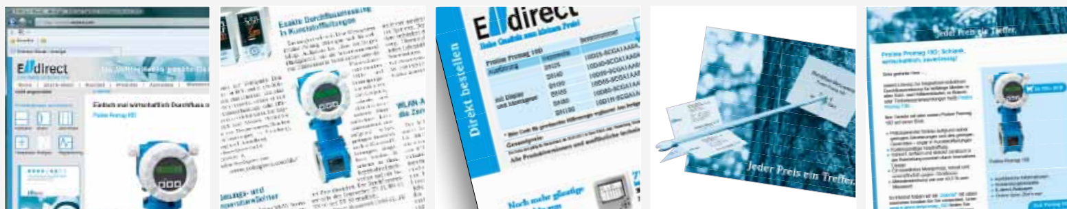
Ein Teil der Kommunikationsmaßnahmen des Proline Promag 10D Produktlaunch von links nach rechts: Online-Shop, Pressemeldung, Zeitschriften-Einhefter, Print-Mailing, e-Mailing

Die Online-Welt wurde zur Stärkung des Interesses an der Problemlösung durch unser Produkt eingesetzt. Es wurde ein zweistufiges e-Mailing an ausgesuchte, bestehende Kundenbeziehungen versendet. Eine speziell erstellte Landingpage, auf die in der Print-Welt und im e-Mailing verwiesen wurde, gab schnelle Orientierung. Webbanner und Wallpaper tauchten als Reminder auf den Fachzeitschriftenportalen auf, in denen der Kunde mit Einheftern vertreten war. So schloss sich der Kreis und op-